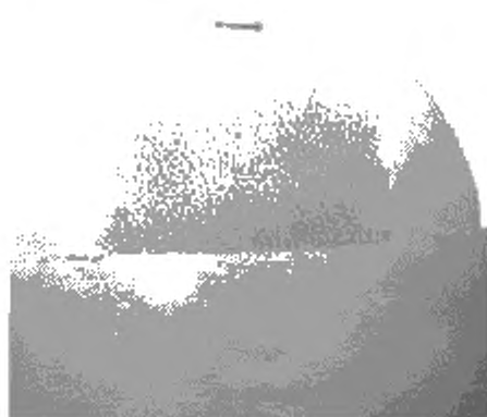
Рисунок А.1 – Пример результатов испытаний на загрязнение с абразивным держателем