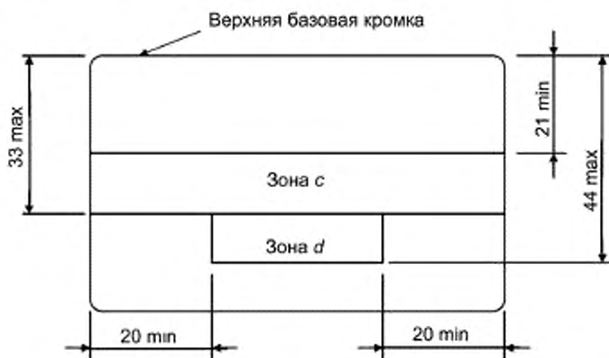
Рисунок 2 — Зоны с ненормируемой непрозрачностью на картах формата ID-1

(Измененная редакция, изменение А2:2012.)