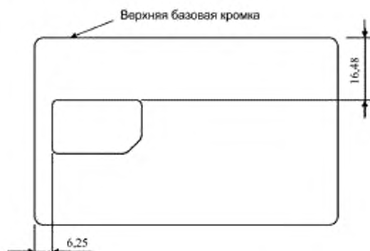
Рисунок В.1 — Расположение карты формата ID-000 относительно карты формата ID-1

Карта формата ID-000 должна быть расположена, как показано на рисунке В.1.