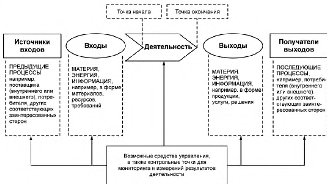
Рисунок 1 — Схематичное изображение элементов процесса

Рисунок 1 дает схематичное изображение любого процесса и иллюстрирует взаимосвязь элементов процесса. Контрольные точки мониторинга и измерения, необходимые для управления, являются специфическими для каждого процесса и будут варьироваться в зависимости от соответствующих рисков.