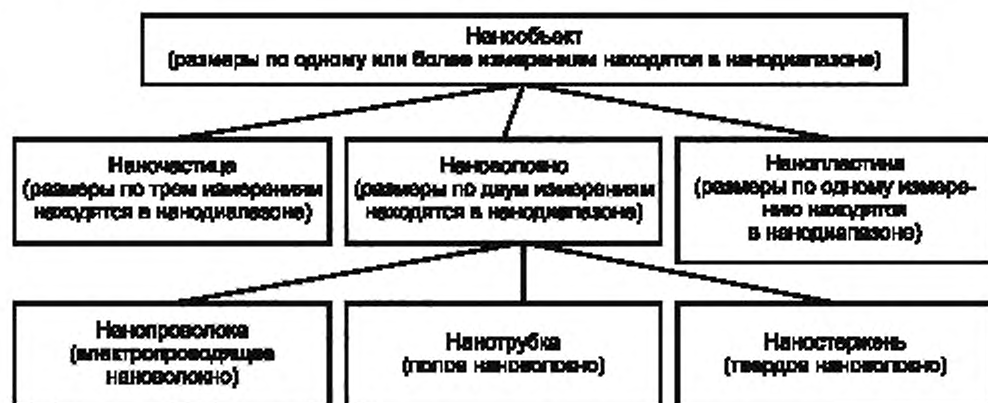
Рисунок 2 — Фрагмент терминологической иерархии нанообъектов

Стандартизованные термины набраны полужирным шрифтом, иноязычные эквиваленты — светлым.