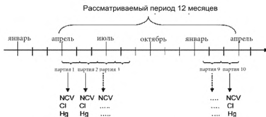
Рисунок D.1 — Пример 1. Результаты измерений характеристик твердого топлива из бытовых отходов, упорядоченные по возрастанию