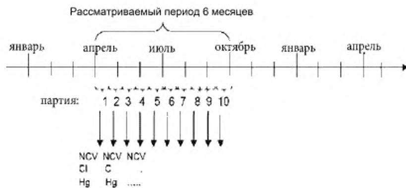
Рисунок D.3 — Пример 3