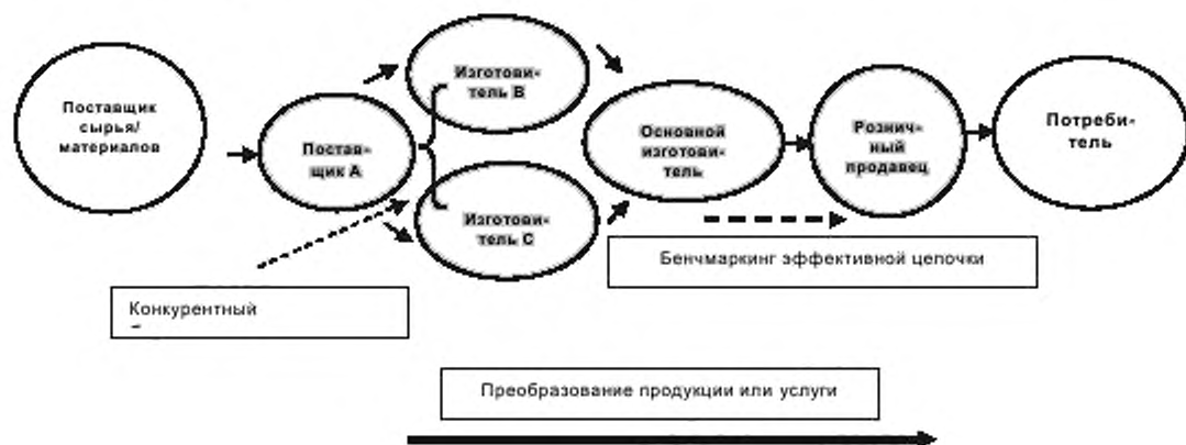
Рисунок 1 — Цикл цепочки поставок

Целью методологии бенчмаркинга является сопоставление этих уровней по всей цепочке поставок снизу до верху или сверху донизу (бенчмаркинг эффективности цепочки поставок) или звеньями одного уровня (конкурентный бенчмаркинг).