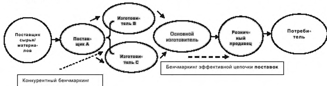
Рисунок 2 — Цикл цепи поставок

Различные организации связаны структурой цепочек поставок. Что касается внутреннего бенчмаркинга, бенчмаркинг цепочки поставок обеспечивает анализ распространения дефектов между различными организациями сверху вниз. В этом случае значение k должно быть оценено и называется k -цепи.