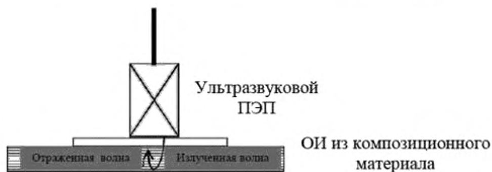
Рисунок 2 — Метод А. Ручной ультразвуковой эхо-импульсный метод