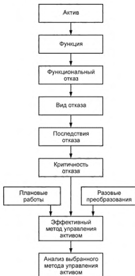
Рисунок А.1 — Блок-схема процесса НОТО