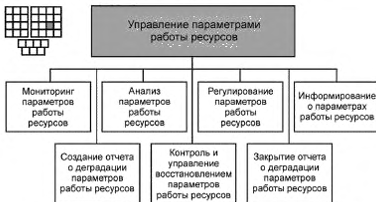
Рисунок 3 — Декомпозиция процесса 1.1.3.4 — «Управление параметрами работы ресурсов» на элементы процессов уровня 3

6.2 Процесс 1.1.3.4 и его элементы процессов уровня 3 предназначены для управления, контроля, мониторинга, анализа, информирования и регулирования значений параметров работы ресурсов на основе исходных данных, получаемых от процесса 1.1.3.5 «Сбор и распределение данных о ресурсах». Процессы 1.1.3.4 должны выявлять нарушения допустимых порогов параметров качества работы ресурсов и оценивать вероятность, в этих случаях, нарушения порогов для параметров качества оказания услуг. Информация о нарушениях порогов должна передаваться процессам 1.1.3.3 «Управление авариями на ресурсах» и процессам 1.1.2.4 «Управление качеством услуг» (см. ГОСТ Р 53633.4—2015 (раздел 7)) для принятия решений по устранению проблем.