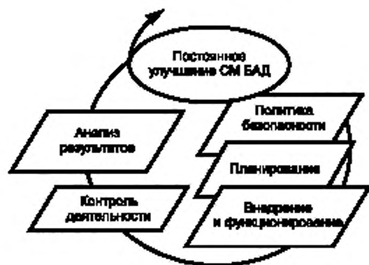
Рисунок 2 — Модель МБАД