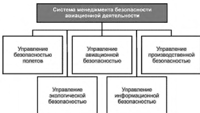
Рисунок 1 — Структура МБАД