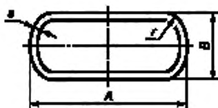
A — большая ось, B — малая ось; r — радиус закругления; S — толщина стенки

4.3 Форма и размеры плоскоовальных труб должны соответствовать указанным на рисунке 2 и в таблице 2.