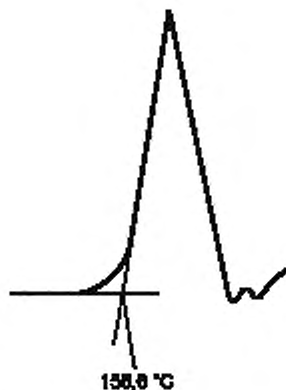
Рисунок А.1 — Эндотерма плавления индия

д) Проводят калибровку аппаратуры в соответствии с инструкциями изготовителя таким образом, чтобы для индия была получена температура перехода первого порядка, равная 156,6 °С. При калибровке точку плавления 156,6 °С принимают за точку пересечения продолжения линии начала пика и продолжения базовой линии, как показано на рисунке А.1.