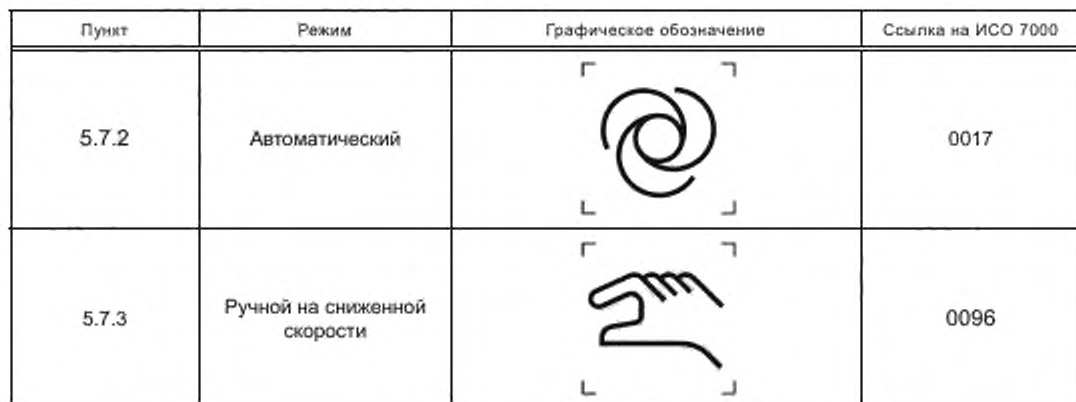
Таблица Е.1 — Обозначения режимов работы робота

В таблице Е.1 приведены примеры графических обозначений, которые могут быть использованы для обозначения режимов работы, определенных в 5.7. Дополнительный описательный текст может быть добавлен к графическим обозначениям для того, чтобы как можно яснее представить информацию о выборе режима и ожидаемых характеристиках.