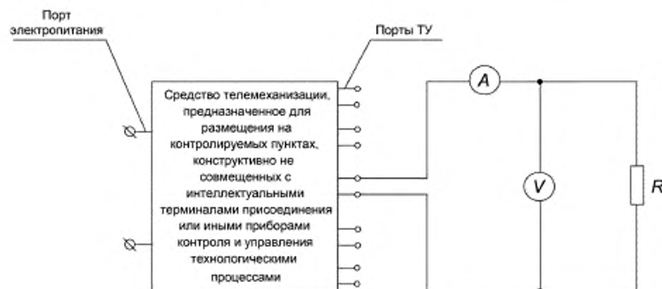
Рисунок 2 — Схема проверки параметров сигнала ТУ

Значение сопротивления R с учетом соединительных проводов должно составлять (150,0 \pm 22,5) Ом.