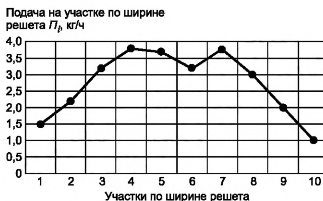
Рисунок Г.1 — График распределения обрабатываемого материала по ширине решета

Г.1.5 Результаты измерений записывают в ведомость учета количества материала, поступающего на участки решета по форме Г.1 (приложение Г). По результатам измерений и расчетов строят график распределения обрабатываемого материала по ширине решета в соответствии с рисунком Г.1 (приложение Г), который характеризует равномерность распределения материала по ширине решета.