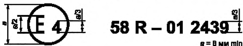
Образец А (См. 6.4, 15.4 и 24.4 настоящих Правил)

Приведенный выше знак официального утверждения, проставленный на транспортном средстве или ЗЗУ, указывает, что этот тип транспортного средства или тип ЗЗУ официально утвержден в Нидерландах (Е4) в отношении задней защиты в случае наезда на основании настоящих Правил под номером официального утверждения 01 2439. Первые две цифры номера официального утверждения означают, что официальное утверждение было представлено в соответствии с требованиями настоящих Правил с внесенными в них поправками серии 01.