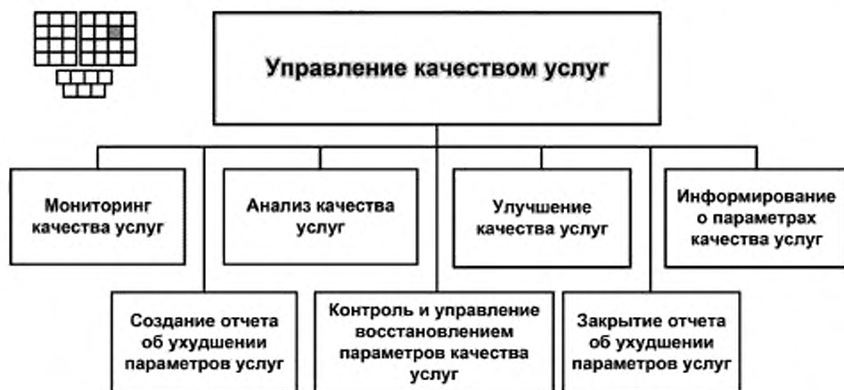
Рисунок 3 — Декомпозиция процесса 1.1.2.4 «Управление качеством услуг» на элементы процессов уровня 3

6.1 Структура процесса 1.1.2.4 «Управление качеством услуг» и соответствующие элементы процессов уровня 3 представлены на рисунке 3.