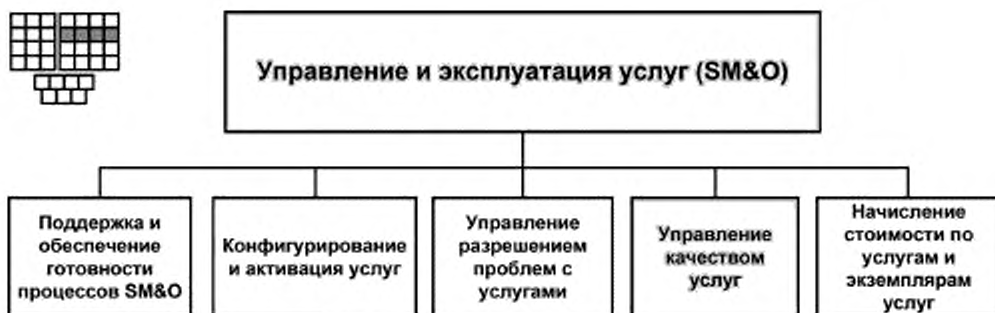
Рисунок 1 — Декомпозиция группы процессов SM&amp;O на элементы процессов уровня 2