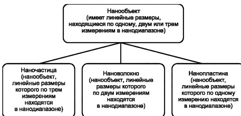
Рисунок 2 — Фрагмент иерархической взаимосвязи понятий, относящихся к нанобъектам

В настоящем стандарте термины и определения установлены с учетом иерархических взаимосвязей между понятиями. Фрагмент иерархической взаимосвязи понятий, относящихся к нанобъектам, представлен на рисунке 2.