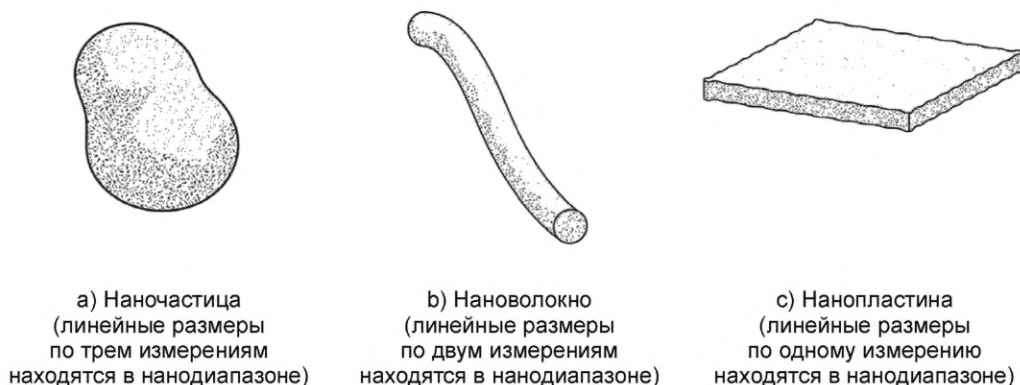
Рисунок 1 — Условные изображения форм трех основных нанобъектов, термины и определения которых установлены в настоящем стандарте

На рисунке 1 представлены условные изображения форм трех основных нанобъектов, термины и определения которых установлены в настоящем стандарте.