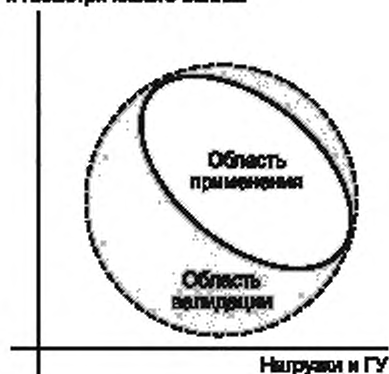
Рисунок 2 — Выбор области валидации

Описание физических процессов и геометрического объема