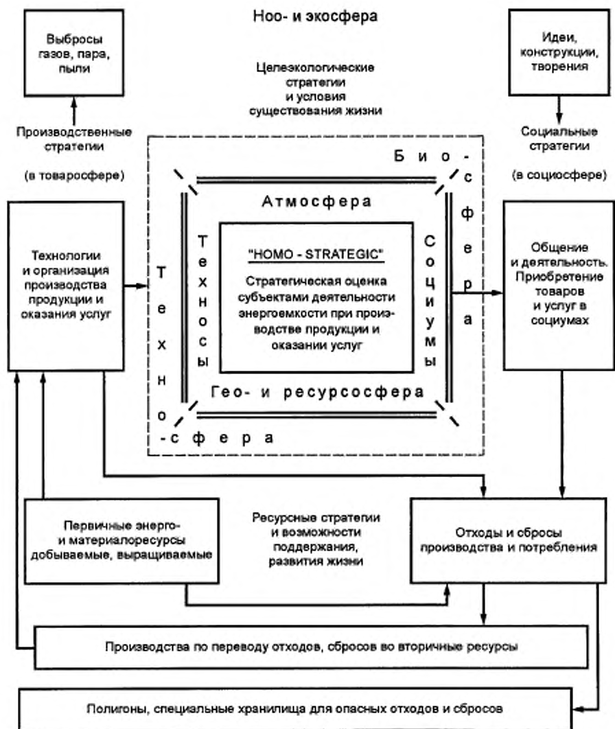
Рисунок А.1 — Стратегическая структуризация сфер жизнедеятельности общества во взаимодействии техносферы с биосферой. (Модель «HOMO-STRATEGIC» на основе ИСО 13600 [7])