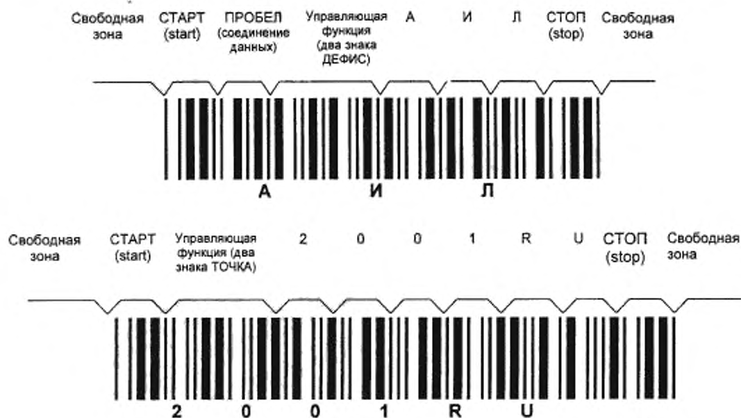
Рисунок Е.2 — Символы штрихового кода, в которых закодированы данные АИЛ2001RU