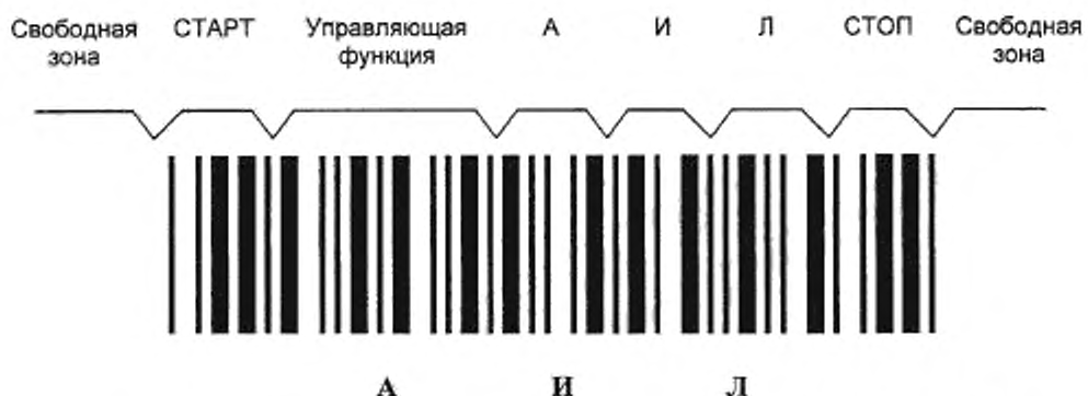
Рисунок Е.1 — Символ штрихового кода, в котором закодированы знаки АИЛ

Е.7 Для обеспечения дополнительной надежности при передаче данных с буквами русского алфавита используют контрольный знак символа набора Код 39РУ.