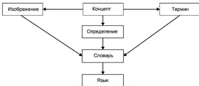
Рисунок 1 — Концептуальная модель терминологии высокого уровня

Каждый концепт имеет одно или несколько определений. Каждое определение относится только к одному концепту.