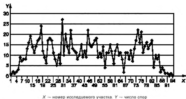
Рисунок 2 — Распределение 1038 спор Stachybotrys chartarum в 94 исследуемых участках следа отбора проб