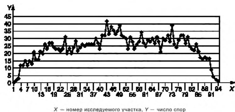
Рисунок 4 — Распределение 214 спор Chaetomium в 94 исследуемых участках вдоль следа отбора проб