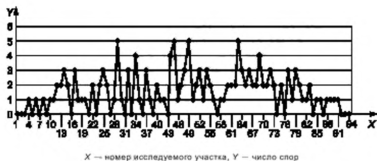
Рисунок 5 — Распределение 144 спор типа Aspergillus/Penicillium в 94 исследуемых участках вдоль следа отбора проб