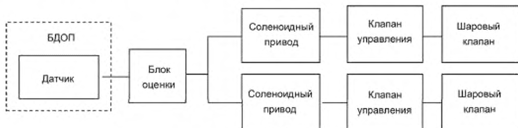
Рисунок А.2 — Архитектура функции, связанной с безопасностью

Все компоненты, за исключением шарового клапана (структура только с SIL 1, SFF менее 90 %), обеспечивают функцию, связанную с безопасностью до SIL 2 согласно таблице 2 IEC 61508-2:2010. Для обеспечения функции, связанной с безопасностью всей системы, выходной канал (соленоидный привод, клапан управления и шаровый клапан) должен иметь архитектуру, как показано на рисунке А.2.