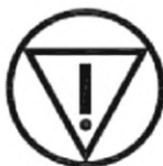
Рисунок 2 — Символ (5638) аварийной остановки

Там, где требуется уточнение, следует использовать символ IEC 60417-5638 (DB: 2002-10) (см. рисунок 2).