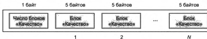
Рисунок 3 — Диаграмма записи данных о качестве (блоки «Качество»)

В таблице 2 представлена структура записи данных о качестве (блоки «Качество»). Значение каждого стандартного показателя качества (определенных в соответствующих частях серии стандартов ИСО/МЭК 29794 применительно к конкретным биометрическим характеристикам), если он рассчитан, должно быть закодировано в 5-байтовом блоке «Качество» в соответствии с ИСО/МЭК 19794-1:2011.