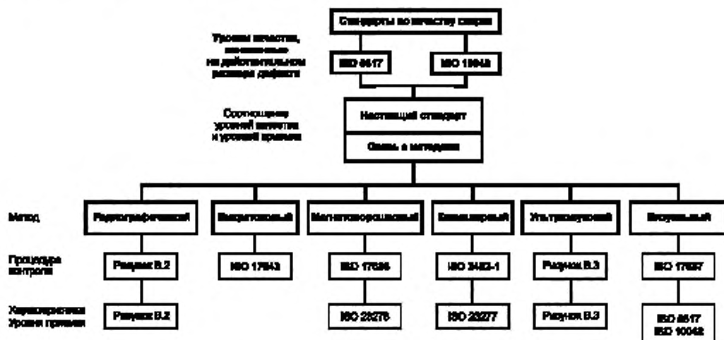
Рисунок В.1 — Диаграмма взаимосвязи стандартов

Диаграмма взаимосвязи стандартов представлена на рисунках В.1, В.2 и В.3.