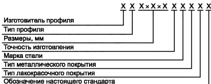
Схема и примеры условных обозначений профилей