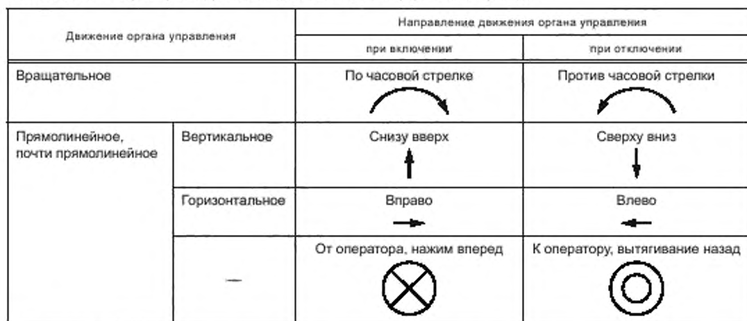
Т а б л и ц а 6 — Характер и направление движения органов управления приводов

5.8.2.3 Приводы разъединителей должны быть снабжены видимыми и не стираемыми в эксплуатации указателями положения. Включенное положение должно быть промаркировано символом «I», а отключенное — символом «0».