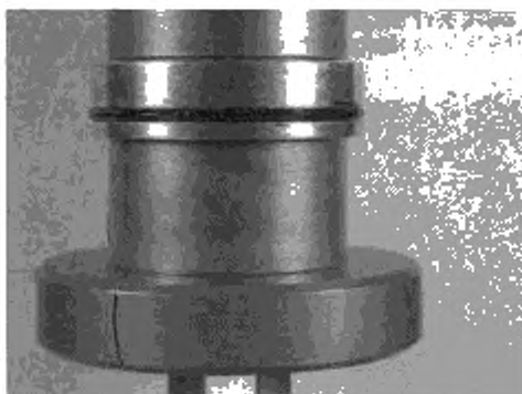
Рисунок 3 — Пример выпуклости надлежащей формы