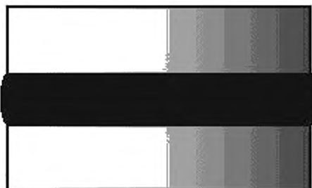
Рисунок 2 — Пример выпуклости надлежащей формы