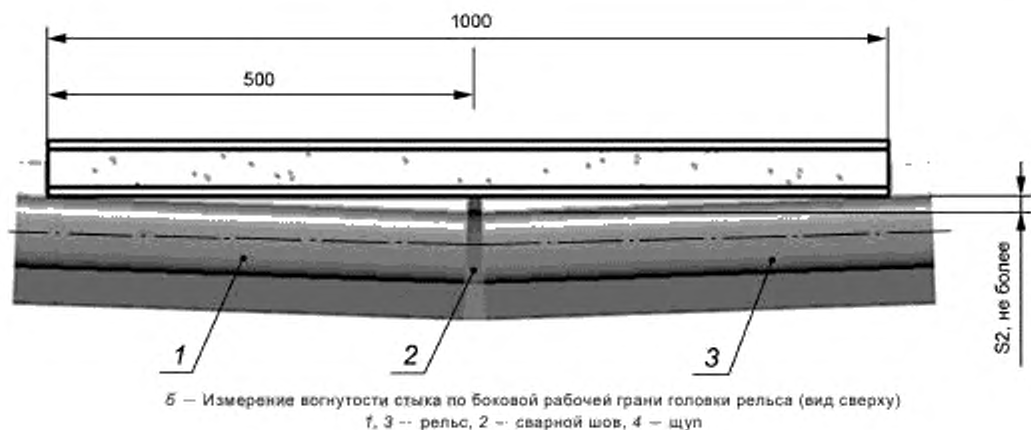
Рисунок 1 — Лист 2

5.3.2.4 Значения разрушающей нагрузки и стрелы прогиба контрольных образцов при испытании на статический трехточечный изгиб должны быть не ниже значений, указанных в таблицах 2 и 3.