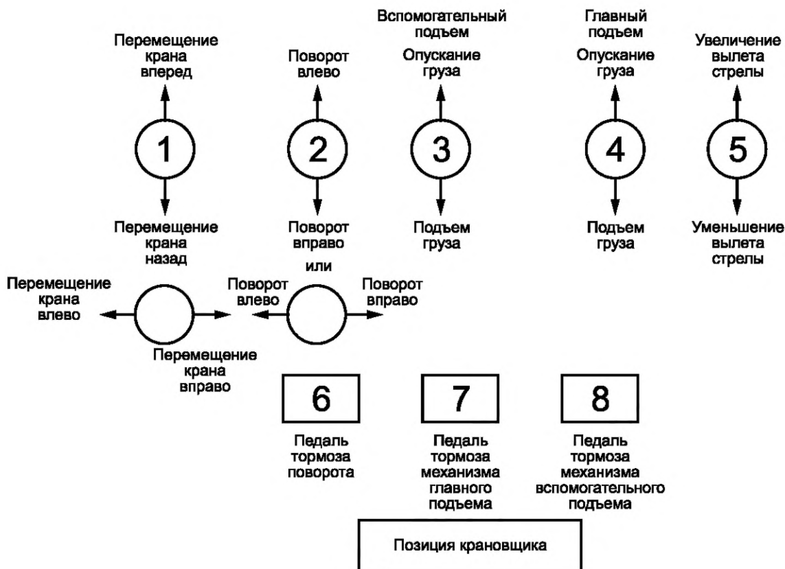
Рисунок 1 — Схема расположения органов управления краном с шарнирно-сочлененной стрелой или краном с фиксированной длиной стрелы, рычаги (рукоятки) управления которых переключаются в две противоположные стороны

Примечание — На каждой позиции органов управления крана должно быть обозначено направление его движения. Это особенно важно, когда направление движения крана и направление движения рычага (рукоятки) логически не согласованы.