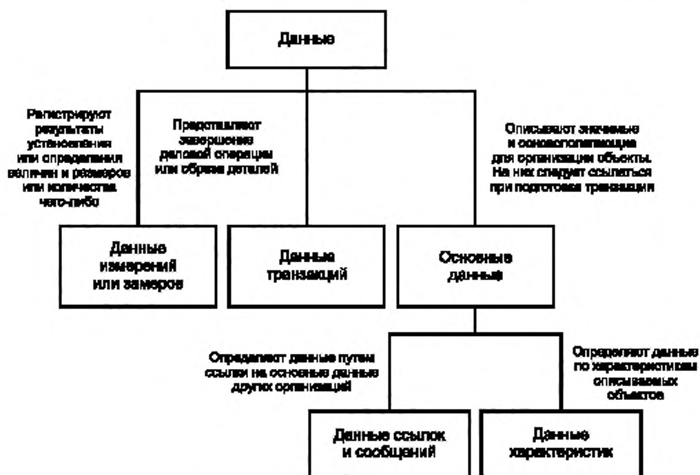
Рисунок 1 — Таксономия данных (для основных данных)

Примечание 2 — На рисунке 1 представлена не полная таксономия данных, а контекст основных данных.