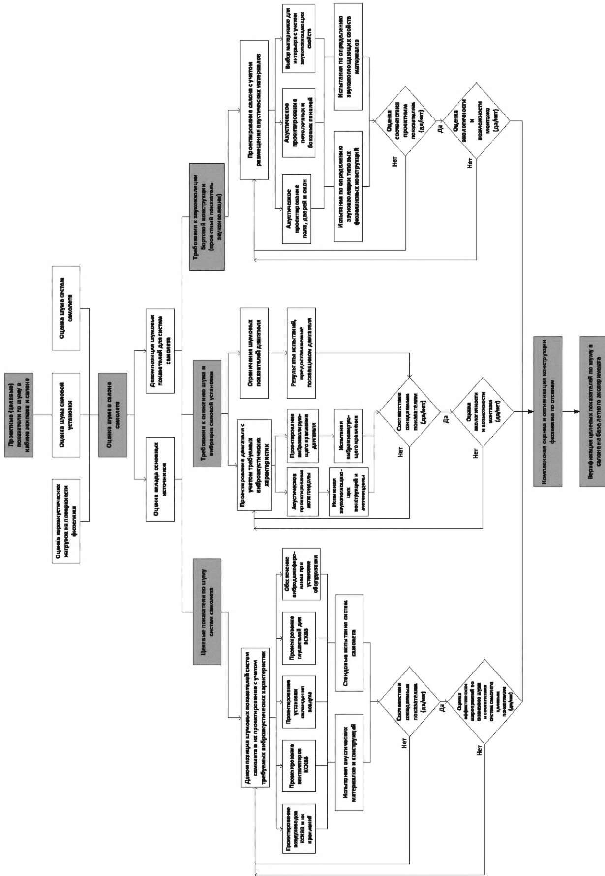
Рисунок 2 — Процесс акустического проектирования в процессе разработки самолета