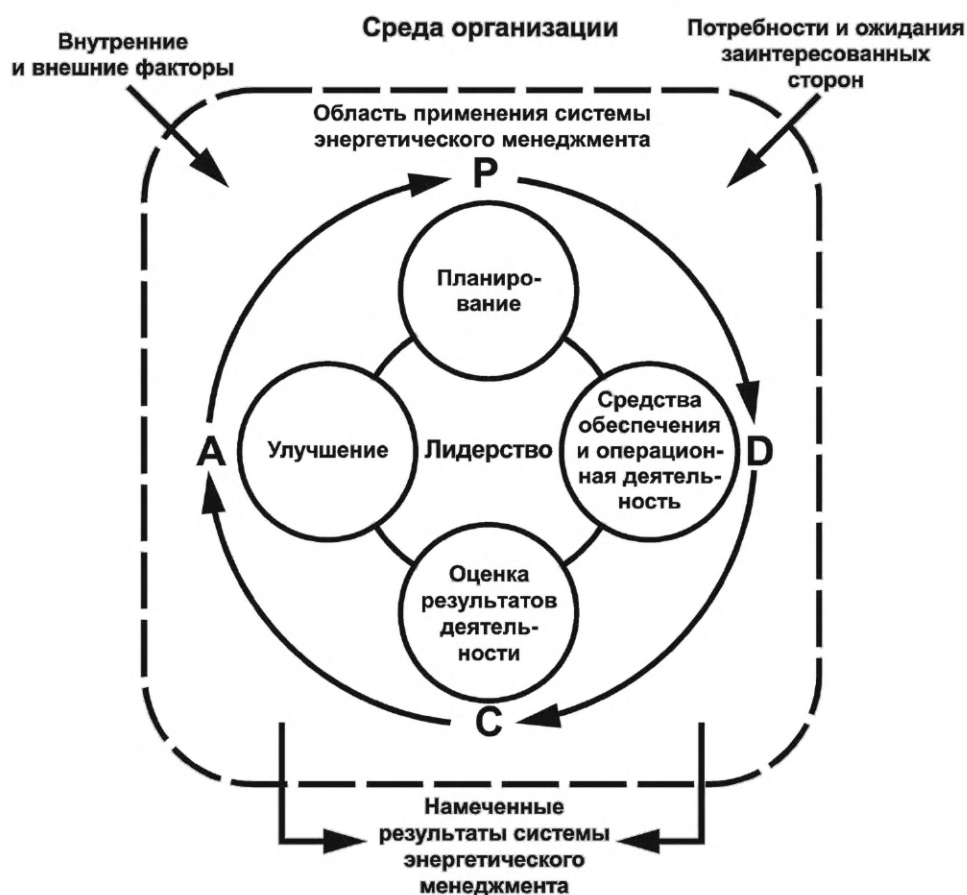
Рисунок 1 — Цикл «Планируй — Делай — Проверь — Действуй»

ИСО 50001:2018 использует общий подход ИСО к MSS, цель которого состоит в повышении согласованности MSS путем предоставления унифицированной и согласованной HLS, идентичного основного текста и общих терминов и основных определений. Это особенно полезно для тех организаций, которые решили использовать единую (иногда называемую «интегрированной») систему менеджмента, которая может одновременно отвечать требованиям двух или более MSS. HLS не предназначена для представления последовательного порядка действий, которые необходимо предпринять при разработке, внедрении, поддержании в рабочем состоянии и постоянном улучшении в соответствии с MSS. HLS в целом предназначена для того, чтобы представить организации возможность достичь постоянного улучшения, и основана на PDCA-подходе. Элементы MSS организованы вокруг функциональных видов деятельности в организации, как показано на рисунке 1.