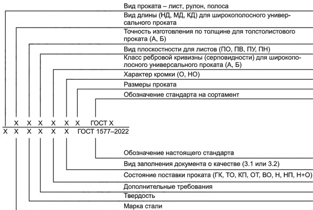
Схема и примеры условных обозначений проката

Примечание — Дополнительные требования указывают в соответствии с 7.3 и 7.4 в виде условных обозначений (например, «КИ», «1С»), при отсутствии условного обозначения — в виде ссылки на соответствующий пункт (например, «с учетом 7.3.1»).