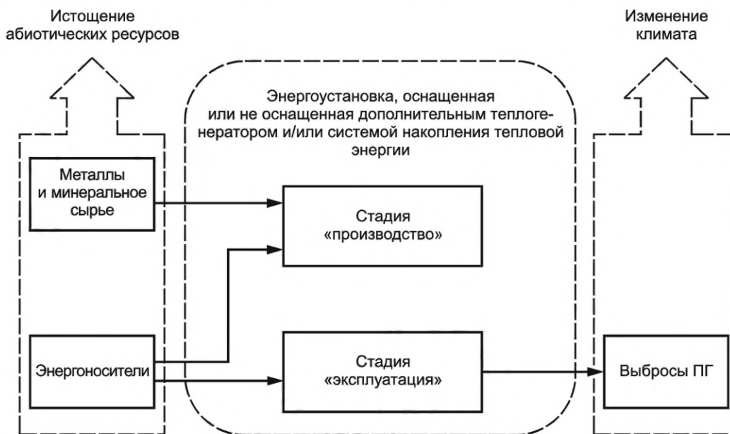
Рисунок 3 — Границы производственной системы, элементарные потоки и категории экологического воздействия

На стадии «эксплуатация» данные о входной электрической мощности (электрической энергии, потребляемой из сети) и расходе топлива являются входными потоками, данные об избыточно потребленной электрической мощности (т. е. сверх потребности), отработавшем тепле и выбросах ПГ при эксплуатации энергоустановки являются выходными потоками. Также, следует учитывать данные о выбросах ПГ, связанных с поставками электрической энергии и топлива, необходимыми для эксплуатации энергоустановки. Данные о выбросах ПГ применяют для определения экологических характеристик энергоустановки по категории экологического воздействия «изменение климата» (см. 5.2).