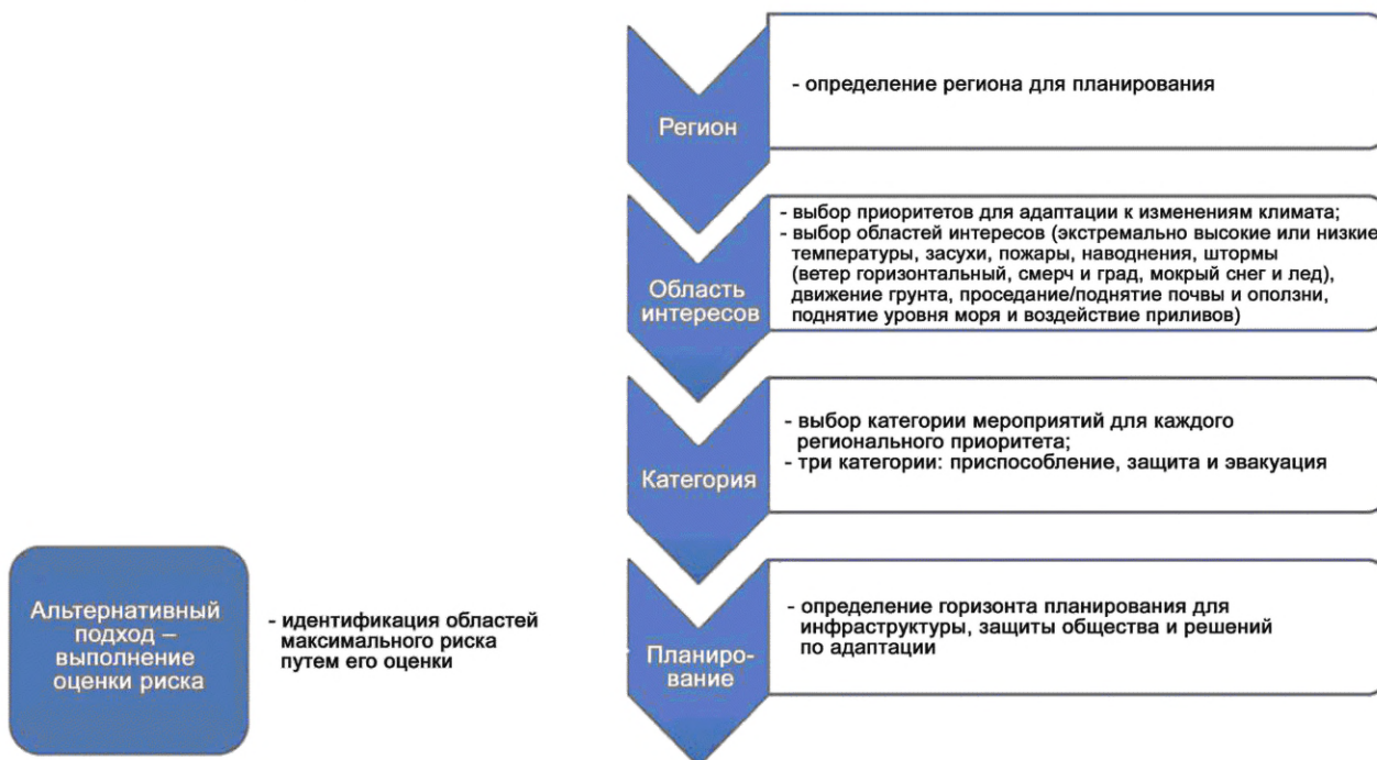
Рисунок 1 — Процедура разработки стратегии планирования адаптации к изменениям климата

План адаптации к экстремальным погодным явлениям должен обеспечивать обучение отдельных специалистов, их групп и предприятий по вопросам снижения рисков и введения в свою деятельность ограничений по безопасности с целью повышения устойчивости к изменениям климата. К разработке соответствующей стратегии и к применению настоящего стандарта можно приступать, начиная с определения приоритетных рисков, которые необходимо устранять (например, путем проведения их оценки). В качестве альтернативного варианта на тот случай, когда эта оценка не проводилась, можно применять подход, приведенный на рисунке 1, начиная с определения соответствующего географического региона. При использовании регионального подхода пользователь должен сначала определить один из подлежащих планированию регионов. Выбор приоритетных проблемных регионов может также основываться на ранее произошедших катастрофических климатических событиях.