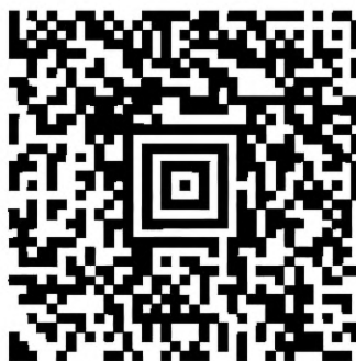
Рисунок А.5 — Символ Aztec Code с параметром «повреждение фиксированных шаблонов»