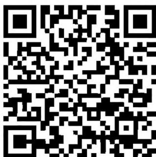
Рисунок А.4 — Символ QR Code с параметром «повреждение фиксированных шаблонов»

Для наглядности повреждение шаблона сегмента А3 на рисунке А.4 разделено в таблице А.3 на две части, в двух отдельных строках, т. е. один модуль, являющийся темным во внутренней области шаблона, и два темных модуля в рамке шаблона шириной в один модуль, которая номинально — светлая и отделяет шаблон поиска от соседних модулей.