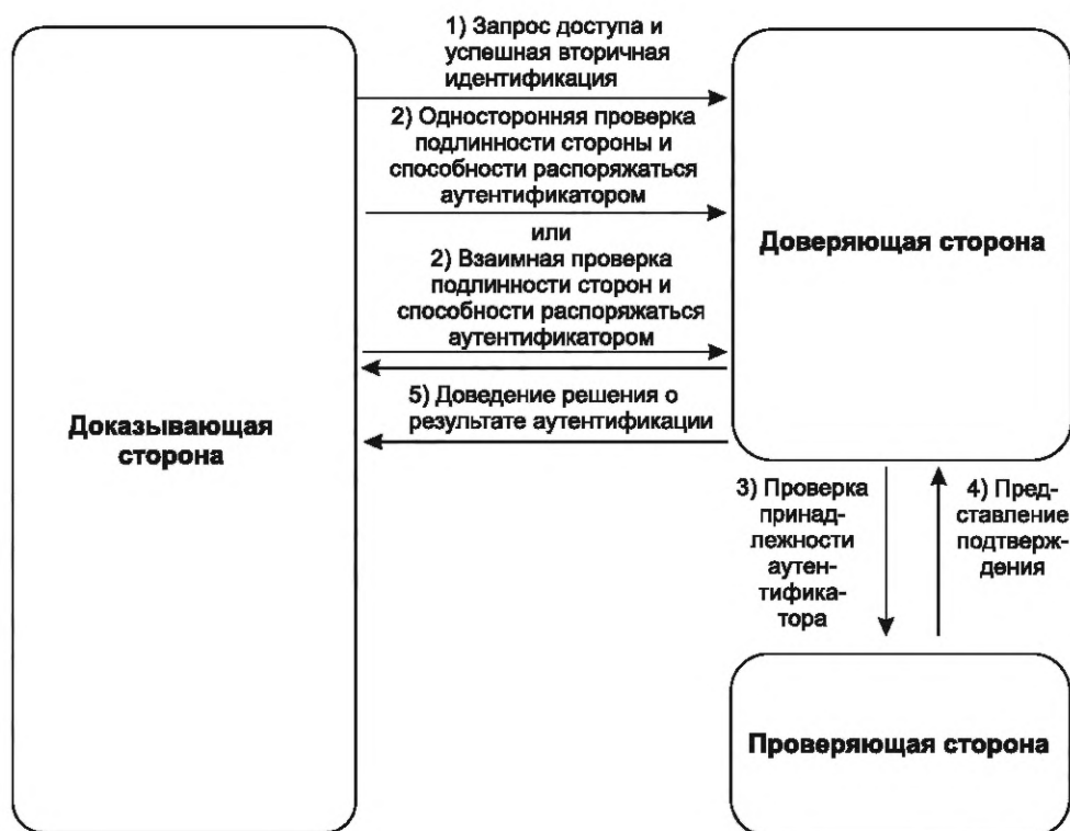
Рисунок 3 — Общая схема взаимодействия сторон при аутентификации

4.8 Необходимость аутентификации устанавливается как для субъектов доступа, которые являются физическими лицами, так и для субъектов (объектов) доступа, которые представляют собой информационные и вычислительные ресурсы. Аутентификация должна осуществляться с учетом данных особенностей субъектов (объектов) доступа, а также с учетом возможности использования и применимости положений настоящего стандарта для конкретной среды функционирования.