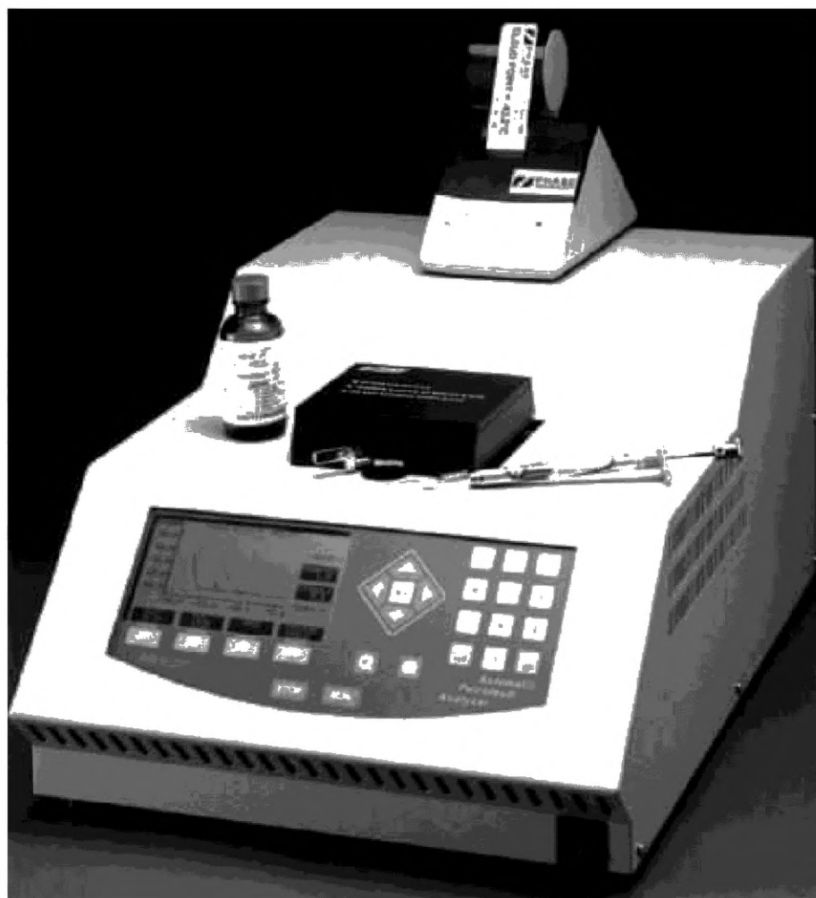
Рисунок А1.3 — Внешний вид аппарата