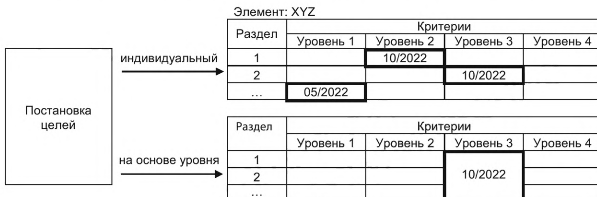
Рисунок 4 — Разные подходы для определения целей

У организации есть выбор между двумя подходами к определению и планированию конкретных целей в зависимости от планируемого результата. Первый — это индивидуальный способ, при котором цель по каждому разделу ставится на индивидуальном уровне. Второй подход заключается в выборе заданного уровня в качестве цели для всех разделов. Пример простого обзора приведен на рисунке 4.