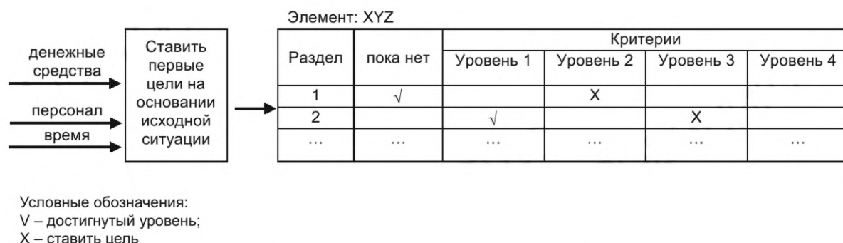
Рисунок 3 — Постановка первых целей

Каждый уровень соответствует возрастающей динамике для каждого критерия раздела в рамках элемента. Первый шаг — определить планируемый уровень для каждого раздела. Прежде чем ставить цель, необходимо убедиться, что такие ресурсы, как денежные средства, время и персонал, доступны для достижения планируемого уровня элемента и будет ли это выгодно для организации. Процесс представлен на рисунке 3.