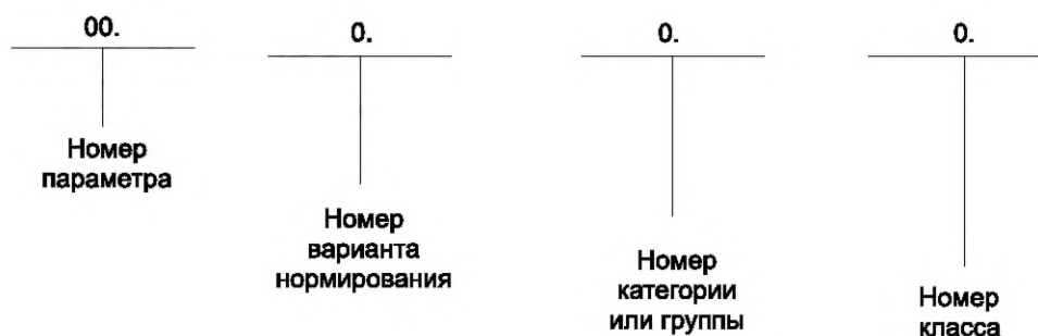
Рисунок Б.1 — Рекомендуемая структура и последовательность записи

Рекомендуемая структура и последовательность записи приведена на рисунке Б.1.