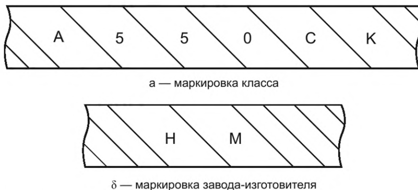
Рисунок Б.1 — Пример прокатной маркировки арматурного проката надписями

Б.1 Маркировка класса арматурного проката надписью (или цифрой порядкового номера) и аббревиатуры завода-изготовителя (или порядкового номера) наносится непосредственно на прокате. Цифры и буквы маркировки следует наносить взамен поперечных ребер, через одно ребро (см. рисунок Б.1).