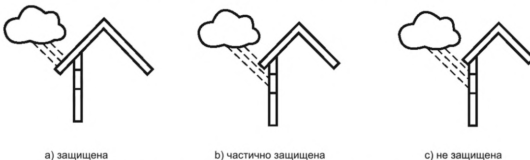
Рисунок А.2 — Степень защиты с помощью глубины карниза

Климат в виде осадков, ветра и прямых солнечных лучей беспрепятственно воздействует на деревянные элементы конструкции, что относится к деревянным элементам конструкции небольших зданий (не более трех этажей) с небольшой глубиной карниза в открытых местах или зданий высотой более 3 этажей, особенно с окнами и дверями, установленными заподлицо с фасадом. Это также относится к деревянным конструкциям без карниза.