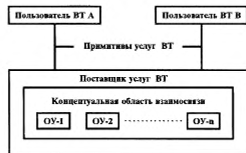
Рисунок 1 — Объекты управления в модели услуг ВТ

Спецификация услуг ВТ представлена в ГОСТ Р ИСО 9040. Она основана на модели, в которой два пользователя ВТ взаимодействуют через общую концептуальную область взаимосвязи (КОВ), являющуюся концептуальной частью поставщика услуг ВТ. Обмен информацией представляется в виде модели, где один из пользователей ВТ изменяет содержимое КОВ, а затем измененное состояние этой КОВ становится доступным для равноправного пользователя ВТ.