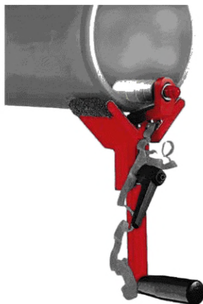
Рисунок 1 — Рекомендуемая конструкция фаскоснимателя