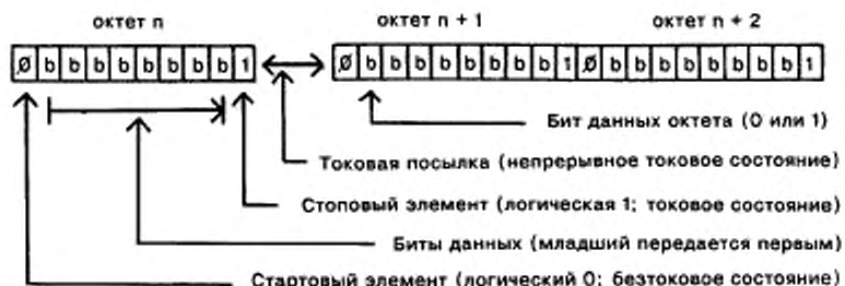
Рисунок 2 — Типичная передача октета при стартстопной передаче