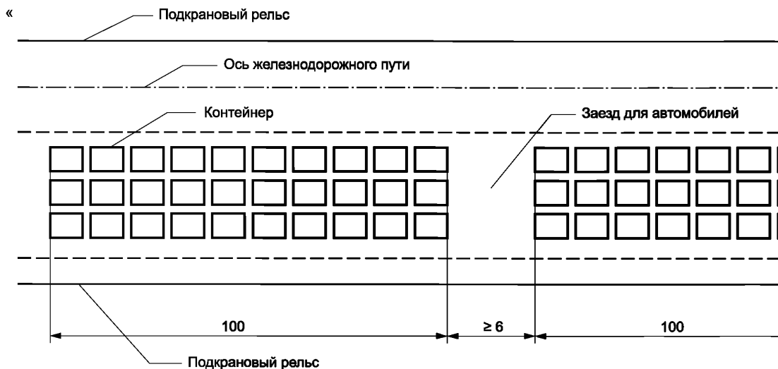
Рисунок 4 — Схема поперечного заезда автомобилей».

Пункт 7.3.12. Дополнить слова: «площадке —» словами: «не менее».