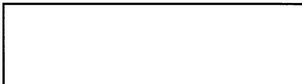
Схема границ эксплуатационной ответственности сторон

Прочие сведения по установлению границ раздела эксплуатационной ответственности сторон _____